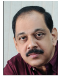
ജെഫ് ആന്റണി ആർക്കിടെക്റ്റ്