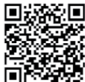
Scan with Smartphone to view Pole Shelving Brochure

Sree Chakra Traders.....96 Ernakulam Ph:9349251708 , 04842302495